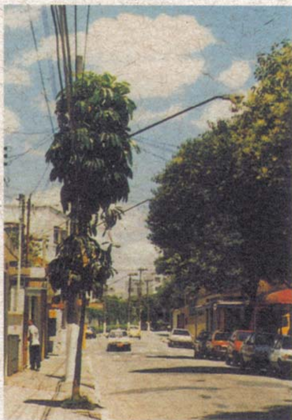
Brassaia ( Schefflera actinophylla )