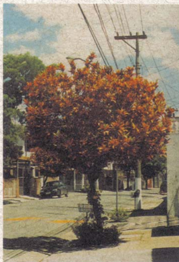
Cróton ( Codiaceum variegatum )